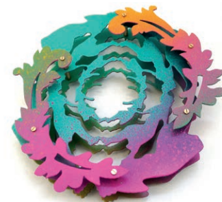
SCHMUCK 2019 - Anna Talbot