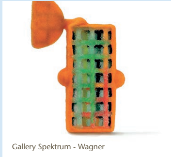
Gallery Spektrum - Wagner