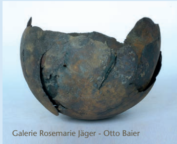
Galerie Rosemarie Jäger - Otto Baier