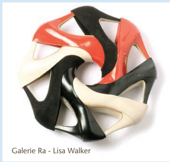
Galerie Ra - Lisa Walker