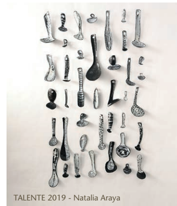
TALENTE 2019 - Natalia Araya

Die Auswahl wurde von der Abteilung für Messen und Ausstellungen der Handwerkskammer für München und Oberbayern zusammengestellt, messe@hwk-muenchen.de